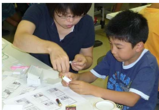
昨年度（本校内で実施）の製作の様子