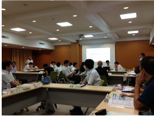
図 1. 班別討議の様子