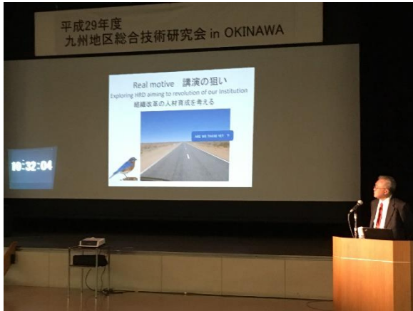
特別講演 I 「長寿企業にみる人材育成」