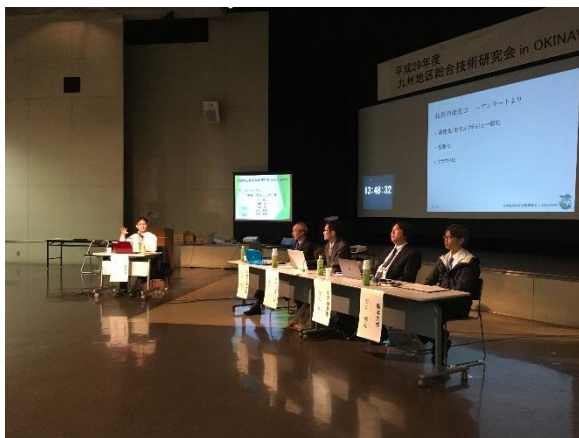
ワークショップ3 「情報・セキュリティ系」