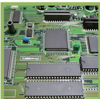
半導体デバイス (電子)