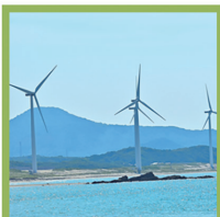
再生可能エネルギー (電気)