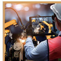
コントロール (制御)