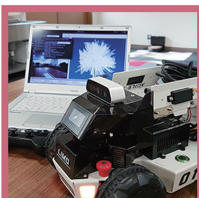
IT技術による デバイス制御