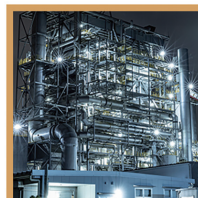
マニュファクチャリング (製作)