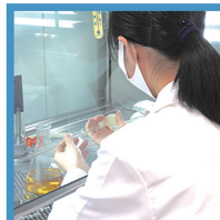
バイオテクノロジー